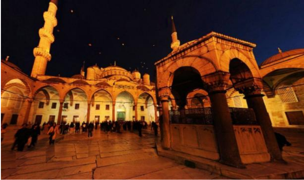
Istanbul – Kappadokia - Konya

Miklagard, Bysants, Konstantinopel, Dersaadet, Nova Roma og Istanbul. Kjært barn har mange navn. Denne dronningen av alle byer ligger ved Bosporusstredet og er Europas største by med over 11 millioner innbyggere. Den ene halvparten av byen ligger i Trakia i Europa, mens den andre halvparten ligger i Anatolia i Asia, og Istanbul er dermed den eneste byen i verden som ligger på to kontinenter.